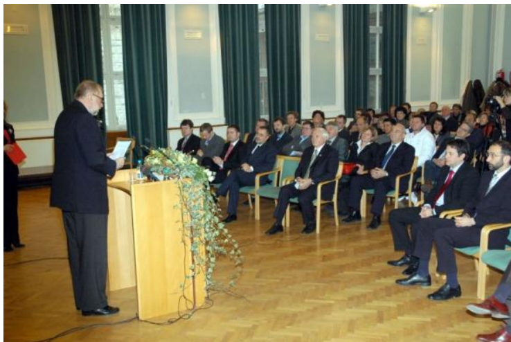
Govor dr. Dimitrija Rupla ob otvoritvi Evro-pf

prakse. S spodbujanjem in usmerjanjem aktivnega raziskovalnega dela študentov, zlasti na podiplomski ravni, ter s spodbujanjem vključevanja v temeljne in aplikativne raziskovalne projekte in z objavljanim raziskovalnih izsledkov v domačih in tujih znanstvenih publikacijah želi fakulteta prispevati k razvoju slovenske pravne znanosti.