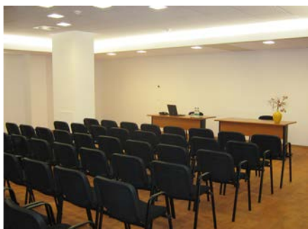
Primer predavalnice na lokaciji Kranj