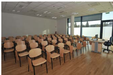
Primer predavalnice na lokaciji Nova Gorica

Dodiplomski študijski program Pravo in management infrastrukture in nepremičnin ter oba doktorska študijska programa se izvajajo kot izredni študij v Kranju.